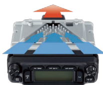
FACC冷却システムイメージ