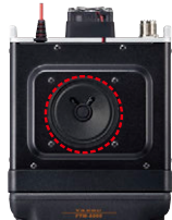
φ66mm/3W 高音質スピーカー

3Wの高音質・大音量の内蔵スピーカーを採用していますので、高品位で明瞭度の高い受信音質で通信を楽しむことができます。オーディオ回路には独自のチューニングが施されており、騒音の激しい屋外の使用でもクリアで快適な交信が可能です。